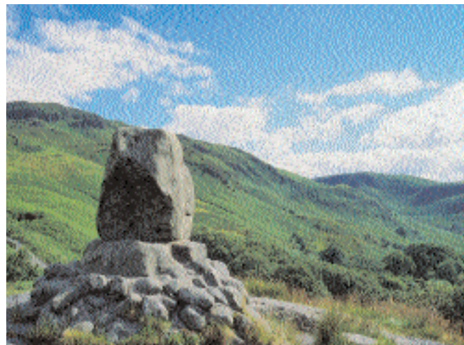
In 1307 versloeg Robert the Bruce hier in de Glen Trool een Engelse militaire eenheid. De Bruce's Stone herinnert aan deze Schotse koning.

wordt onder andere gewaarschuid voor mist; wandelaars krijgen ook de raad om ruim voldoende tijd voor de wandeling uit te trekken. Het goed onderhouden deel van het pad eindigt wanneer u boven enkele kleine watervalletjes het dal van de Buchan Burn bereikt. Van hieraf is de Benyellary, die hoog boven het dal verrijst, al te zien.